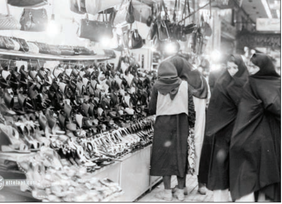
نمایی از میدان توپخانه دهه ۳۰

گرفتاری دولت بنی‌صدر در شب عید ۵۸: شلاق بز نیم یا مغازه‌ها را پلمب کنیم؟ به گزارش اطلاعات آنلاین، پس از پیروزی انقلاب اسلامی کمیته‌های تشکیل شده در اصفاف به شکل خودجوش با احکام دادگاه‌های انقلاب با گرانفروشان مقابله می‌کرد. روش رایج این کمیته‌ها شلاق زدن کسبه در مقابل واحد صنفی بود. بعد از پایان انتخابات ریاست جمهوری در بهمن ۱۳۵۸، هنوز نهادهای دولتی و قضایی درباره برخورد با گرانفروشان تدبیری نداشتند. به دنبال اختلاف نظر پیرامون روش مجازات گرانفروشان و محکومین میان مقامات رده بالای مملکتی و کمیته امور صنفی، مجازات شرعی شلاق زدن گرانفروشان متوقف شد و دادگاه شرع کمیته امور صنفی مدتی است برای گرانفروشان چنین حکمی صادر نمی‌کند. در حالی که کمتر از ۱۸ روز به عید نوروز باقی‌است، قیمت انواع کالاها بر مصرف مردم به خصوص میوه، کفش و انواع پوشاک روز به روز گرانتی می‌شود. به طوری که اکثر مردم به خصوص طبقه کم در آمد جامعه قادر نیستند کلیه ما بحتاج شب عید خود را خریداری کنند. براساس گزارش رسیده از کمیته امور صنفی از صبح امروز سه گروه بسیار از متخصصین و خبرگان کفش و پوشاک مامور شدند محل‌هایی که بورس کفش و پوشاک است، زیر نظر بگیرند و به محض مشاهده گرانی در این فروشگاه‌ها صاحبان شان را تحت تعقیب قرار دهند. عکسی از بازار شب عید در همان سال‌ها را تماشا کنید.