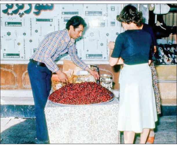
خرید زغال اخته در تهران - دهه ۵۰

قاب نوستالژی ۲ دی ماه ۸۱: کودک کارگر و نان و سنگک و تخم‌مرغ و تن ماهی به دست در حال ترداز خیابان شرعی، نیش پمپ ترک کند و این بار به این دلیل در کانون توجه رسانه‌ها قرار گرفته است.