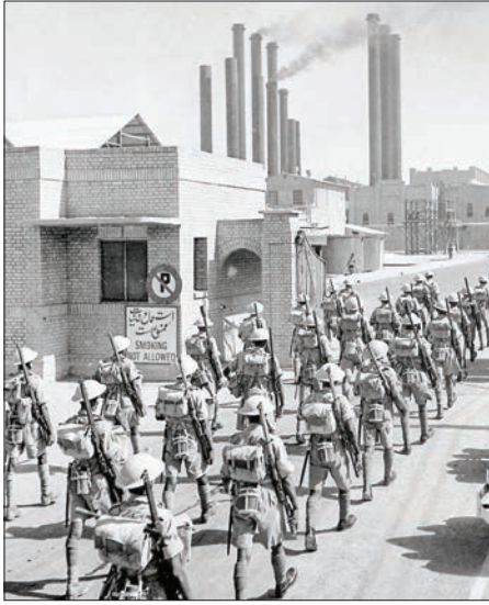
قاب تاریخ ۸ لحظه تاریخی ورود قوای اشغالگر بریتانیایی (پیاده‌نظام هندی) به بزرگترین پالایشگاه جهان (در آن زمان) آبادان - سال ۱۳۲۰