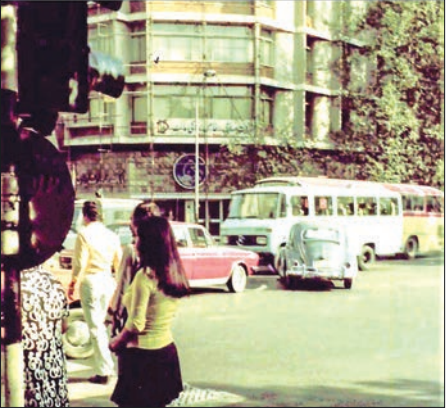
قاب نوستالژی ۲ تهران - سال ۱۳۵۴.

اشرف پهلوی در جریان بازدید از کارخانه اتومبیل‌سازی مرسدس بنز آلمان هنگام ملاقات با مالکان و مدیران کارخانه مشاهده می‌شود.