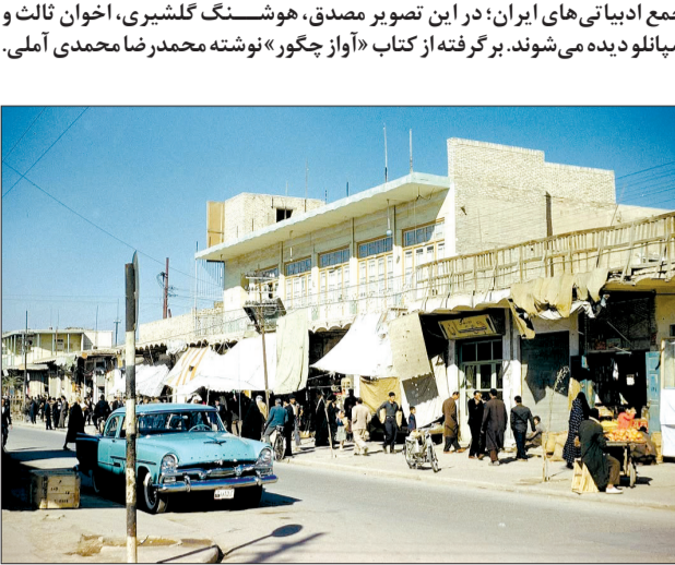
قاب نوستالژی ۱ احمدآباد آبادان - بین یک - اوایل دهه ۴۰

برگرفته از کتاب «آواز چوگر» نوشته محمدرضا محمدی آملی.