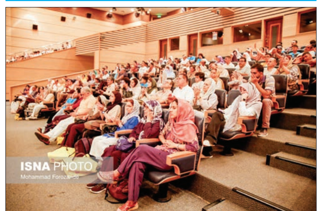
مسابقات انتخابی المپیک جهانی روباتیک ۲۰۲۴ در جزیره کیش