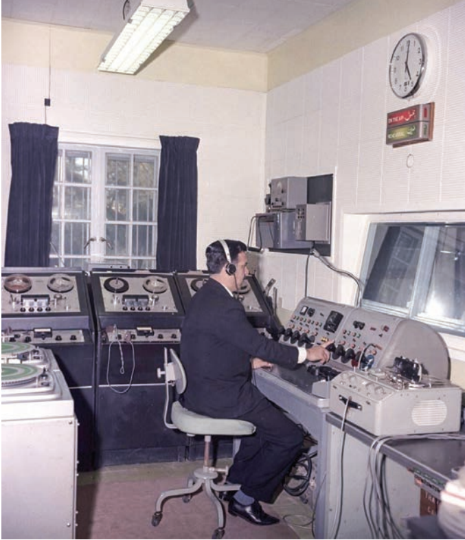
قاب نوستالژی ۳

سیاست‌ورزان دهه ۶۰؛ عکس متعلق به سال ۱۳۶۵ است. در این تصویر موسوی اردبیلی (رئیس قوه قضاییه)، آیت‌الله هاشمی‌رفسنجانی (رئیس مجلس) و عباس شیبانی دیده می‌شوند. (انتخاب)