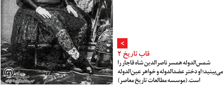
قاب تاریخ ۲

این تصویر متعلق به دهه ۳۰ در تهران است. در عکس خودروهایی از شرکت بنز و شورولت دیده می‌شوند.