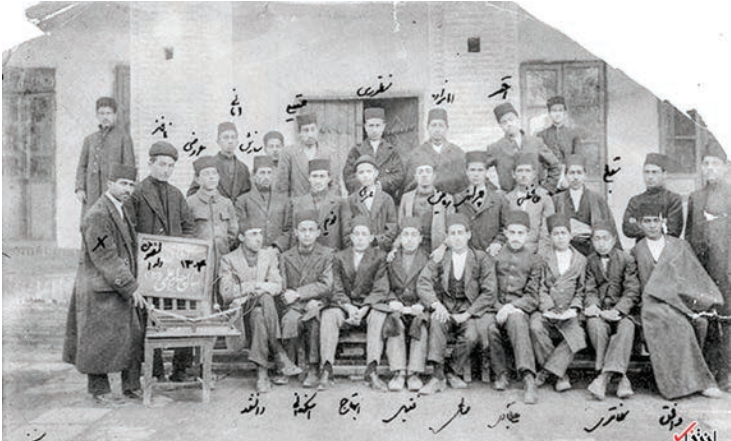
قاب تاریخ ۱

استودیوی رادیو نفت آبادان - اواخر دهه ۱۳۴۰. ساختمان این بنا با قدمتی بیش از یک قرن، از نخستین بناهای مدرنی است که توسط شرکت نفت ایران و انگلیس ساخته شده است.