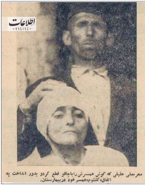
مخبرمحل حقیقی که گوش همسرش را با جاقو قطع کرد در بدو ۱۳۱۱ خ. اتفاقاً کشور همسر خود در بیهارستان.