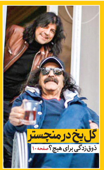
گل یخ در منچستر ذوق زدگی برای هیچ؟ صفحه ۱۰