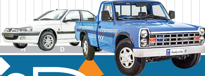
فرارسیدن عید فطرا تبریک می‌گوییم

رئیس پلیس راهور فراجا: «بدنه خودروهایی داخلی» استحکام کافی در تصادفات را ندارد | صفحه ۵ | رایتیون