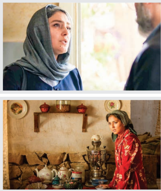
در انتهای شب؛ تازه ترین سریال زین العابدین

«عطر اود» ساخته هادی مقدم دوست، جزو فیلم های متاخر زین العابدین است که این هفته اکران عمومی می شود. او برای این فیلم نامزد دریافت سیمرغ نقش اول زن شده؛ اتفاقی که با «عرق سرد» هم رخ داد، با این تفاوت که برای این یکی نامزد سیمرغ مکمل شده بود. «جاده قدیم»، «اسرافیل»، «طلا»، «سمفونی نهم»، «دست انداز»، «زلاوا»، «دسته دختران» و ... جزو شاخص ترین فیلم های این بازیگر است. زین العابدین