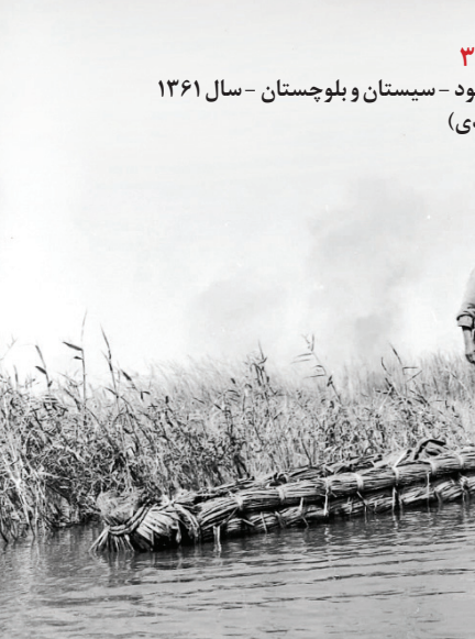
وقتی هامون، دریاچه بود - سیستان و بلوچستان - سال ۱۳۶۱