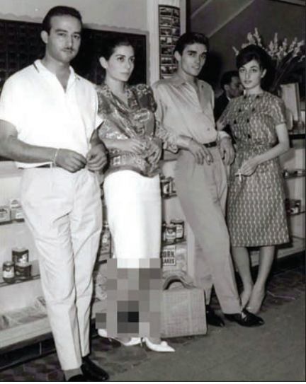
باشگاه گلستان آبادان - سال ۱۳۳۷