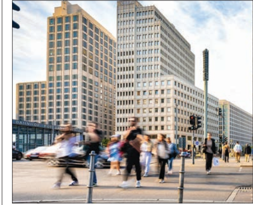
این مطالعه روی افرادی متمرکز بود که بین ۲۱ تا ۴۰ سال سن داشتند و به تنهایی زندگی می کردند، همچنین درآمد ماهانه آن ها بین ۱۱۰۰ یورو (حدود ۱۲۵۰ دلار) تا ۲۶۰۰ یورو (۲۹۵۰ دلار) بود. آن ها می توانستند از پول دریافتی برای هر چیزی که می خواهند استفاده کنند. تنها شرط این بود که هر شش ماه یک بار، یک پرسشنامه در مورد وضعیت مالی، الگوهای کاری، رفاه روانی و مشارکت اجتماعی پر کنند.

مطالعات مشابهی نیز در دیگر مناطق انجام شده است. به عنوان مثال، آزمایشی در استاکتون، کالیفرنیا در سال ۲۰۱۹ شروع شد که ماهانه ۵۰۰ دلار به افراد پرداخت می کرد. محققان آن زمان تاکید کردند که چنین