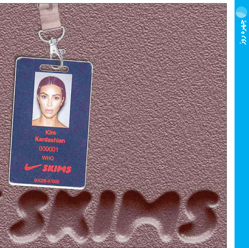
کیم کارداشیان، مالک برند «اسکیمز»، شراکت تجاری خود را با برند «نایکی» آغاز کرد و به محض شروع این شراکت، سهام نایکی ۶/۷ میلیارد دلار افزایش یافت.

نیوسام از دونالد ترامپ برای تسریع فرآیند پاکسازی آوارها تشکر کرده است. با این حال، در نامه نیوسام به تهدیدات اخیر دولت ترامپ اشاره‌ای نشده است. دولت ترامپ اعلام کرده است که کمک‌های فدرال ممکن است مشروط به شرایط خاصی باشد، از جمله کاهش بودجه کمیسیون ساحلی کالیفرنیا که مسئول تنظیم توسعه سواحل و حفظ دسترسی عمومی به سواحل است. ترامپ این نهاد را به‌عنوان مانعی در مسیر بازسازی به‌ویژه در مناطق ساحلی می‌داند. (صدای آمریکا)