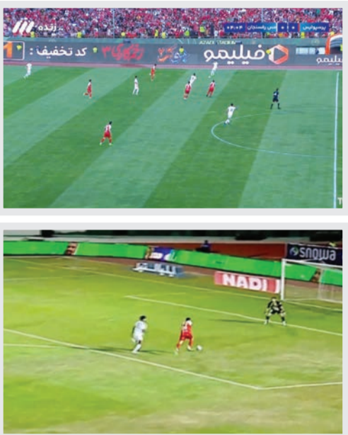
تبلیغات پلتفرم‌ها در بخش زنده