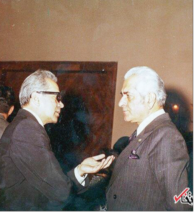
قاب مشاهیر ۲ عکس کمتر دیده شده از آخرین رئیس ساواک: ناصر مقدم (زاده ۳ تیر ۱۲۹۷ در تهران - درگذشته ۲۱ فروردین ۱۳۵۸ در تهران) سپهبد نیروی زمینی، معاون نخست‌وزیر و چهارمین و آخرین رئیس سازمان اطلاعات و امنیت کشور (ساواک) بود. او بلافاصله پس از انقلاب ایران دستگیر و در فروردین ۱۳۵۸ اعدام شد. تیمسار مقدم از امضا کنندگان اعلامیه بی‌طرفی ارتش در ۲۲ بهمن ۱۳۵۷ بود.