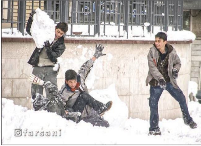
قاب نوستالژی ۲: برف بازی در مجیدیه شمالی تهران - بیستم بهمن ۱۳۸۲