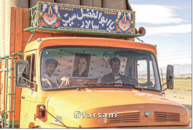
قاب نوستالژی ۱ عکس نیکو کریمی در کامیون بنز؛ حوالی ذوب آهن اصفهان - ۱۵ خرداد ۱۳۸۱

قاب مشاهیر ۱ عکسی از شیلا خداداد، مهناز افشار و الناز شاکر دوست - اواخر دهه ۸۰ (فراید)