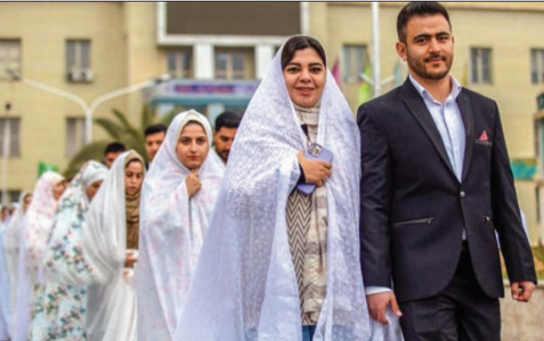
مراسم ازدواج ۱۹۰ زوج دانشگه افسری صبح جمعه همزمان با نیمه شعبان در دانشگاه افسری برگزار شد.