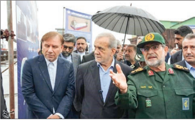
تصویری از بازدید رئیس جمهور از مجموعه صنعتی شهید محلاتی نیروی دریایی سپاه در بوشهر. در سمت راست بز شکیان فرمانده نیروی دریایی و در سمت چپ او استاندار بوشهر را می بینید.