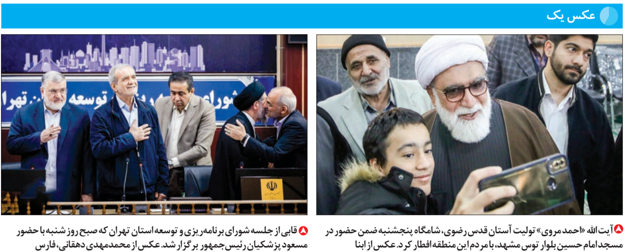
آیت الله «حمد مروی» تولیت آستان قدس رضوی، شاهنامه پنجاهمین جشنواره حضور در مسجد امام حسین بلوار توس مشهد، با مردم این منطقه افطار کرد.