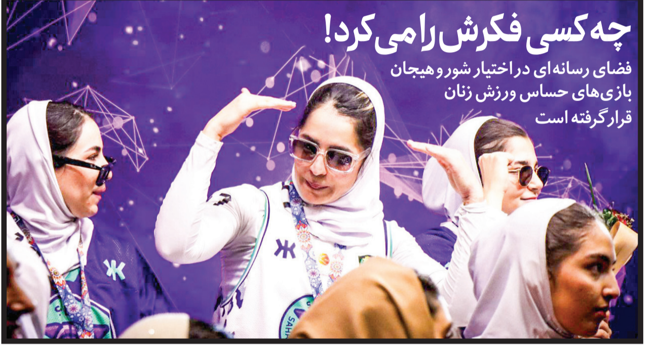
چه کسی فکرش را می کرد! فضای رسانه ای در اختیار شور و هیجان بازی های حساس ورزش زنان قرار گرفته است

دعوا بر سر قیمت محصولات شرکت های صادراتی در بازار داخلی دوباره بالا گرفته صفحه ۳