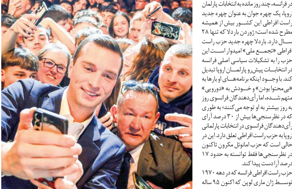
ژرژ لادلا، رهبر حزب راست افراطی فرانسه که در دهه ۱۷

چهره جدید راست افراطی فرانسه که اروپا را به چالش می کشد، کیست؟