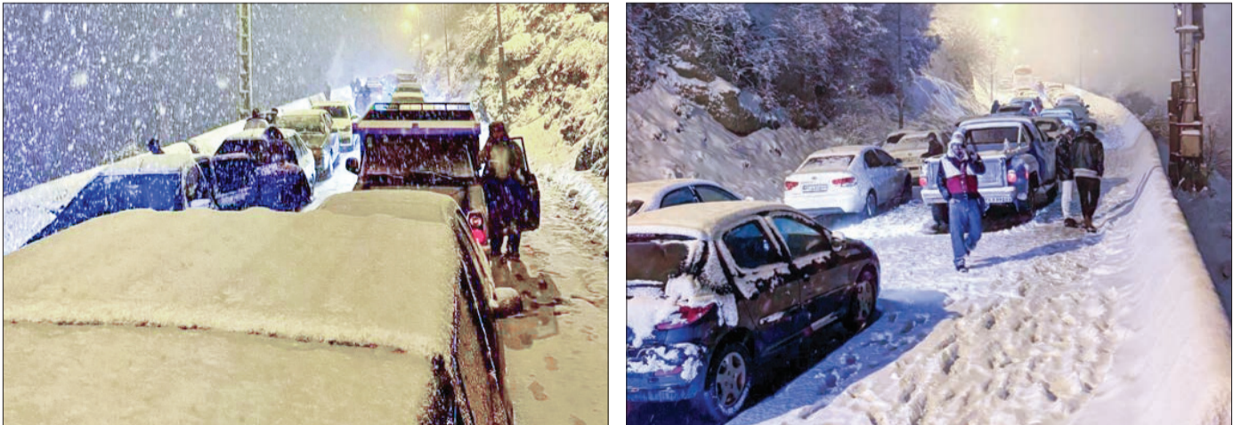
تصاویری از بارش برف روز جمعه که به راه‌بندان و گیر افتادن خودروها در جاده جالوس منجر شد.